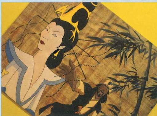
Uchod, Y Deillion, maen Portland, 1959. Ar y chwith, Turandot o gyfres Operavox (Cartŵn Cymru).