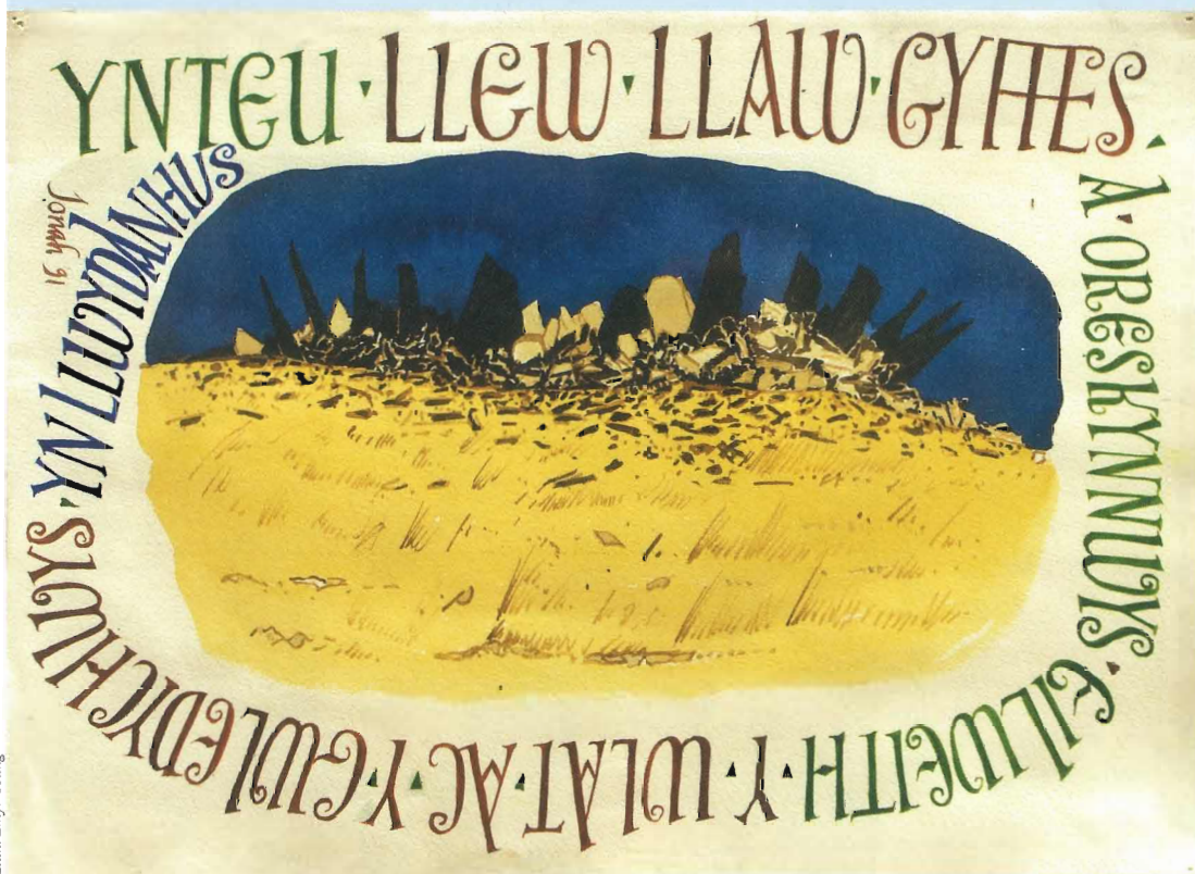
Ynteu Llew Llaw Gyffes, dyfrlliw ar bapur, 1991.