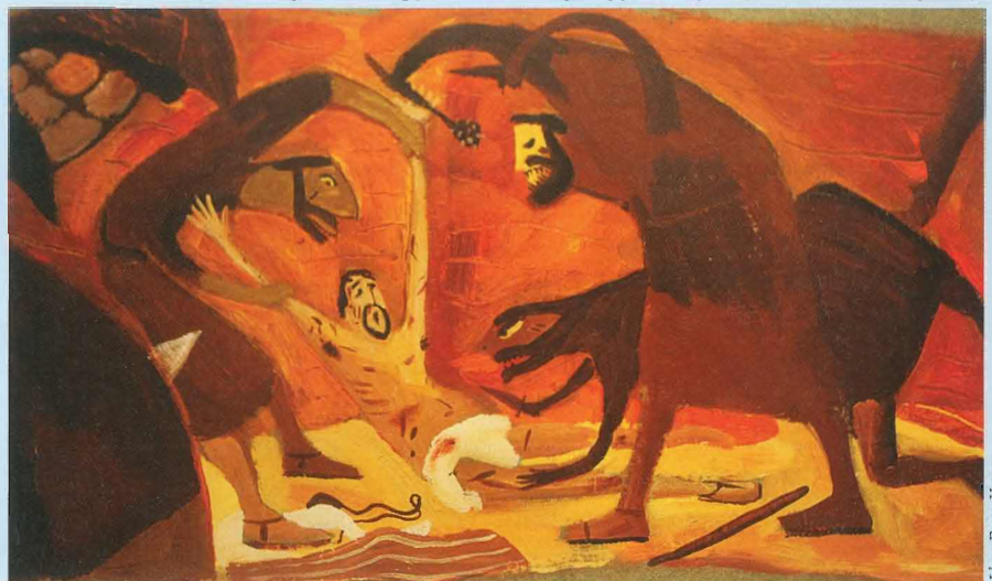
Cynllun ar gyfer Dameg y Samariad Trugarog yn Gŵr y Gwyrthiau (Cartŵn Cymru)